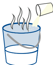
2. Concentration de la poudre: 140 g/l de lait