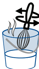
3. Mélanger énergiquement jusqu'à dissolution complète de la poudre