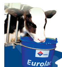
5. Température de buvée: 38 - 42 °C